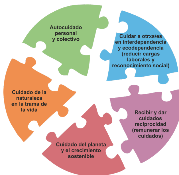
Esquema 1. Elementos de la agenda de cuidado feminista para el desarrollo de políticas públicas

Por otro lado, cabe señalar que el feminismo blanco hegemónico ha tendido a idealizar el cuidado como un atributo moral superior de las mujeres. Esta visión limita la comprensión de las diversas formas en que el cuidado se organiza en contextos racializados, donde las lógicas de blanquitud/blanquedad del Estado, el mercado y las OSC generan una exclusión permanente. Estos sectores no se benefician de las políticas de ‘conciliación’, carecen de empleos dignos, enfrentan barreras para el alquiler y el acceso a una salud intercultural, y viven bajo el asedio constante de la Ley de Extranjería y el racismo sistémico.